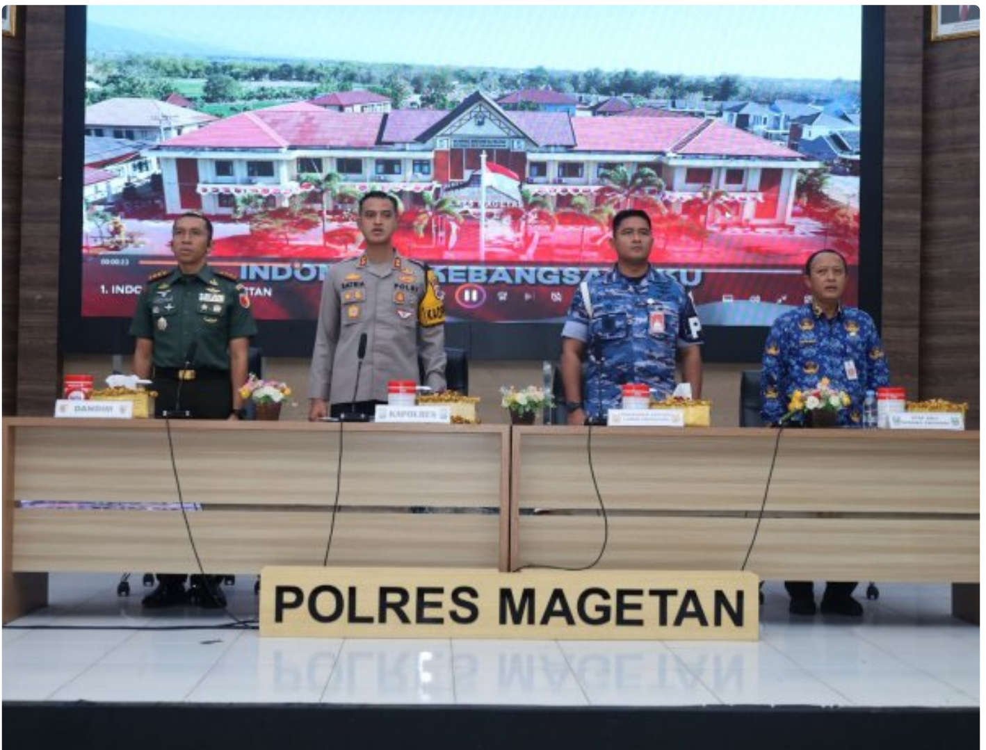
Dandim 0804/Magetan Hadiri Rakor Lintas Sektoral kesiapan operasi lilin 2024

Magetan. – Guna meningkatkan Sinergitas dalam rangka kesiapan operasi lilin