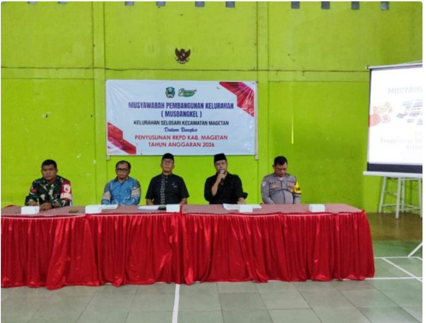
Babinsa Koramil 0804/01 Magetan Hadiri Musyawarah Pembangunan Kelurahan (MUSBANGKEL)